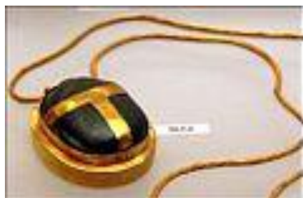
Skarabeus z Théb (15. stol. př. n. l.)