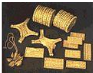
Zlatý poklad z El Carambolo (Sevilla, 7. stol. př. n. l.)