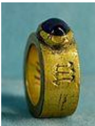
Biskupský pozlacený prsten s ametystem (Paříž, 15. stol.)