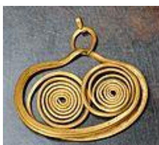
Zlatá náušnice (Mykény, 18. stol. př. n. l.)