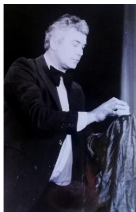
děda na Pražském hradě roku 1987