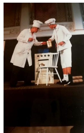
děda s tátou v roce 1992 na mistrovství ČSFR v kategorii komická magie