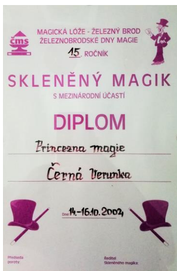
Můj první diplom, který jsem získala teprve ve 3. měsíci života v roce 2004.