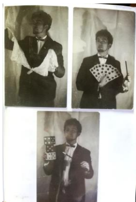
můj děda v roce 1964