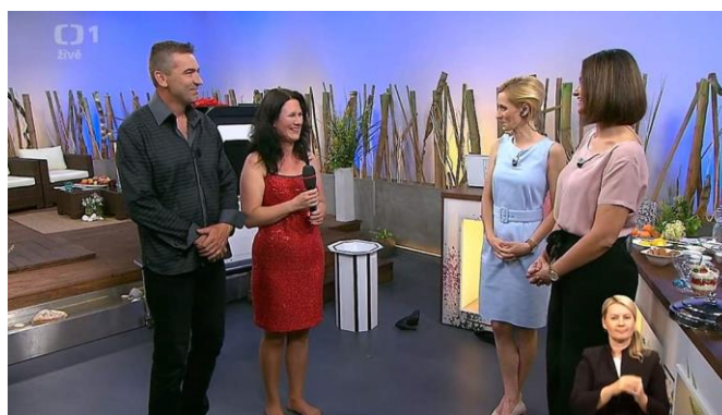
současné vystoupení táty a mamky na ČT1 v pořadu Sama doma dne 7. 6. 2019