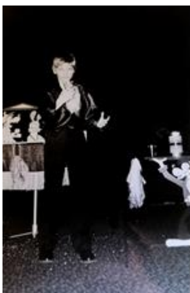
začátky mého táty v roce 1987