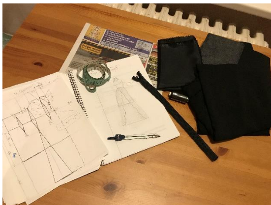
Obrázek č.2 – pomůcky

Na tuto práci jsem potřebovala šicí stroj, látky, jehly, nitě, křídu, metr, pravítko, kružítko, tužku, propisku, zip, blok a špendlíky