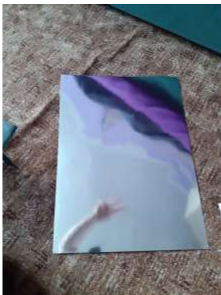
obr. 40 Zrcadlo