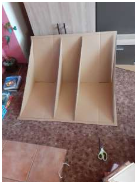
obr. 46 Přilepené trojúhelníky k A střeše