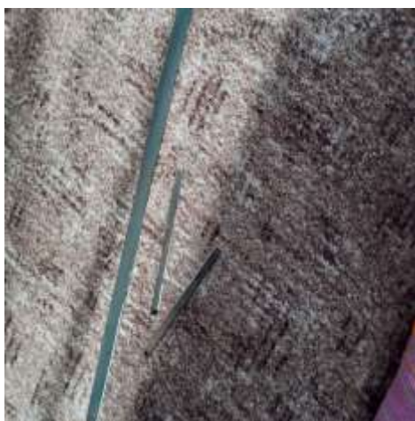
obr. 9 Rámy