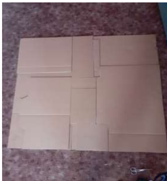
obr. 2 Podklad domu

Jako první jsem si musela určit, jak chci ten model veliký. Vytvářela jsem ho v měřítku 1:10. Takže jsem si vystříhla z kartonu čtverec metr krát metr veliký, a velikost místností jsem si vyměřila podle sebe.