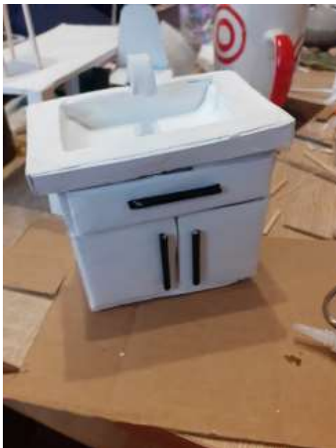
obr.36 Hotové umyvadlo