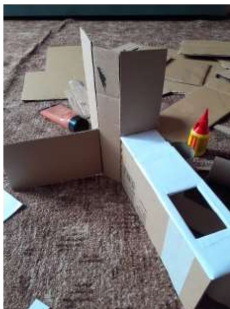
obr. 29 Lepení skříněk