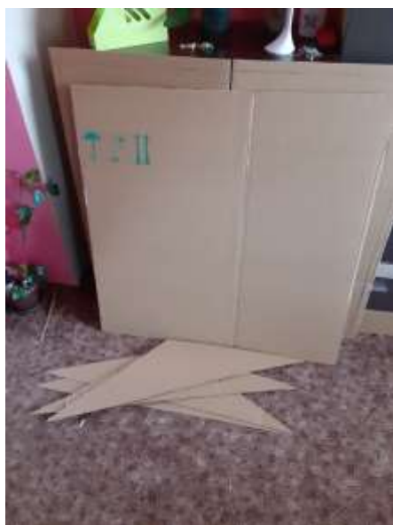
obr.45 Připravené věci