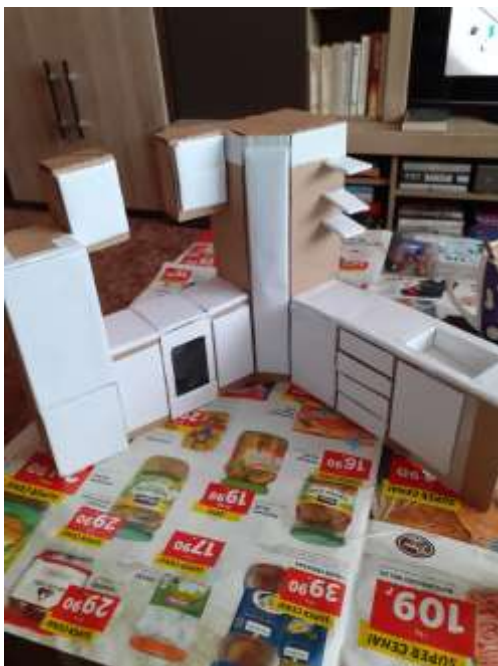
obr. 32 Splená kuchyň