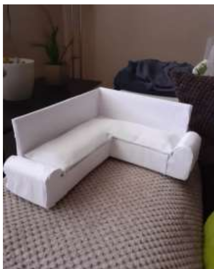
obr. 26 Gauč