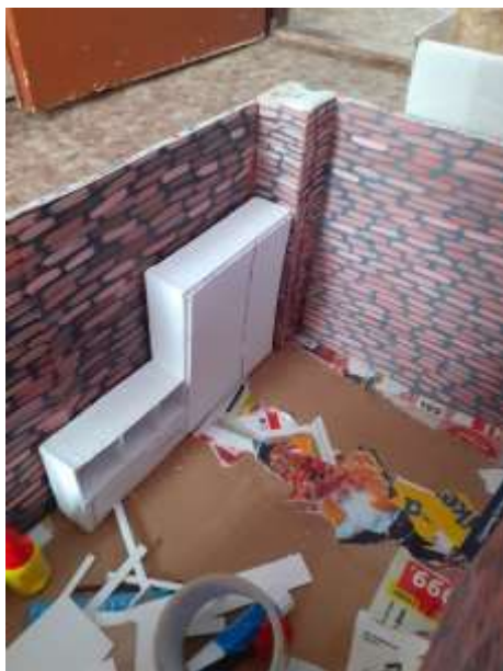
obr. 20 Hotová skříň