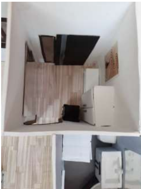
obr. 48 Předsíň