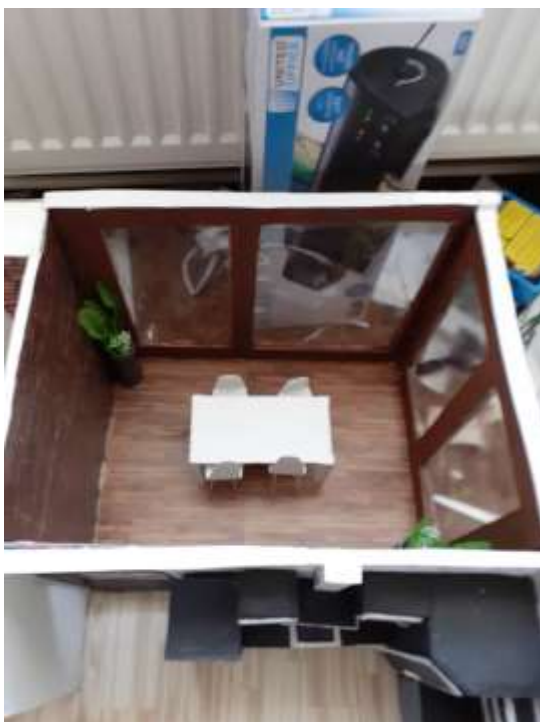
obr. 58 Zimní zahrada