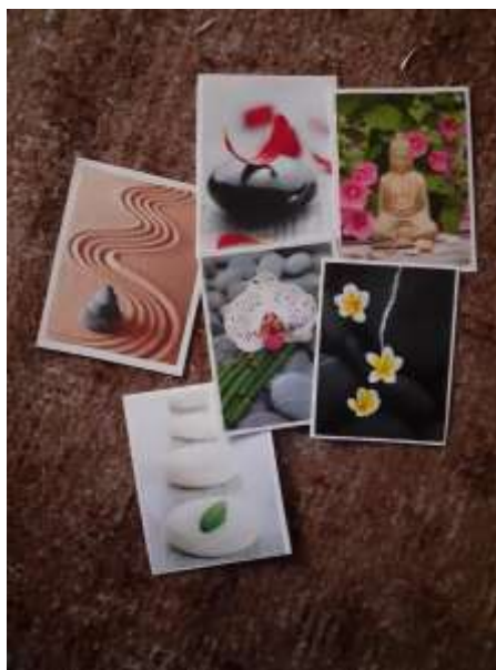
obr. 41 Obrazy