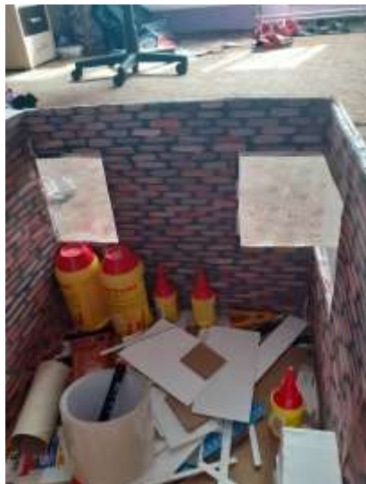
obr. 12 Cihly