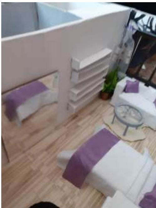
obr. 56 Ložnice 2