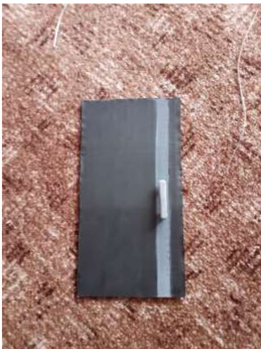
obr. 18 Vchodové dveře