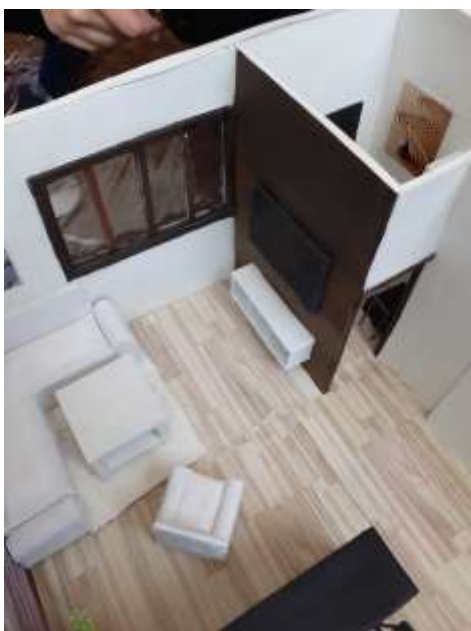
obr.50 Obývací pokoj