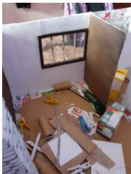
obr. 14 Stěna v obýváku