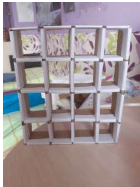
obr. 21 Polička