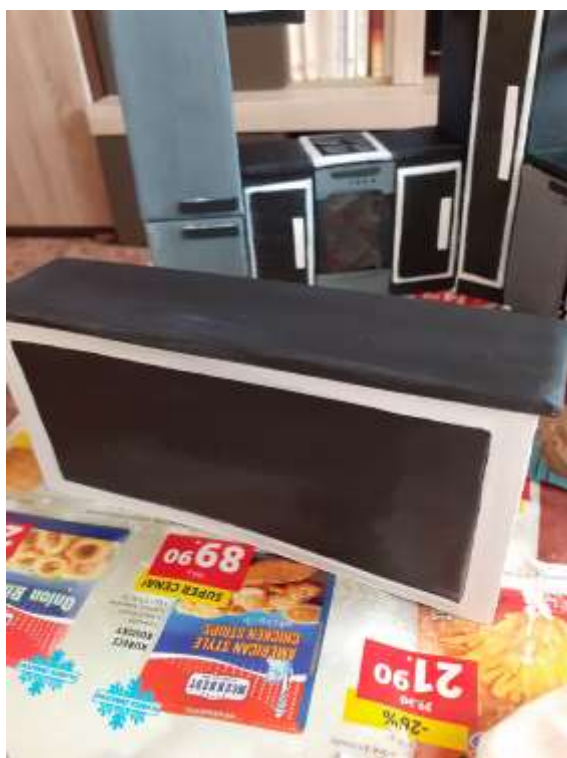
obr. 30 Natřený kuchyňský ostrůvek