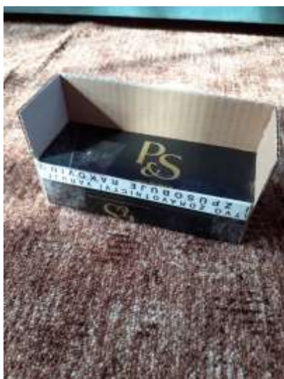
obr. 22 Pohovka