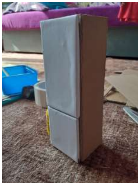
obr. 28 Lednice