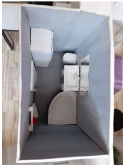
obr. 49 Koupelna