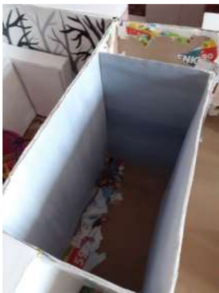
obr. 16 Koupelna