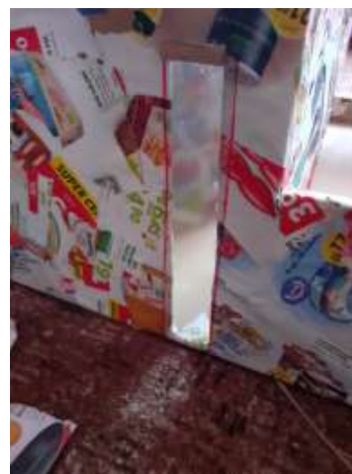
obr. 10 Okno