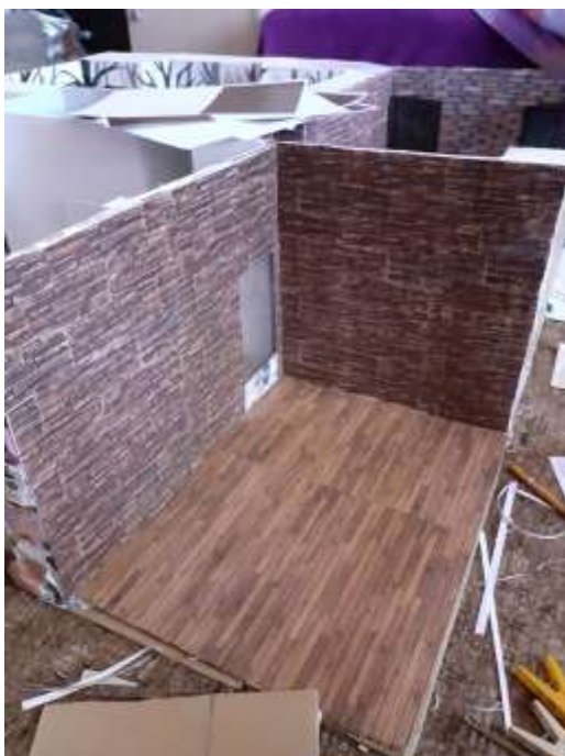
obr. 42 Podlaha a obklad