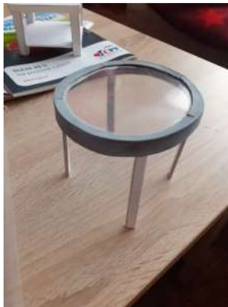
obr. 25 Skleněný konferenční stolek