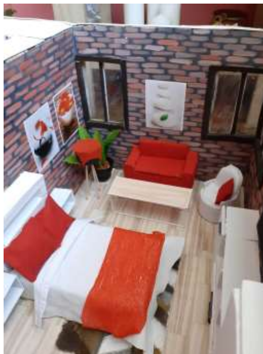
obr. 53 Ložnice 1