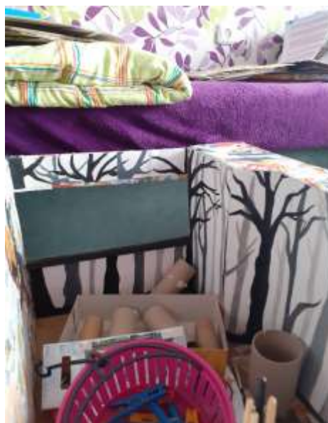
obr. 13 Stromy