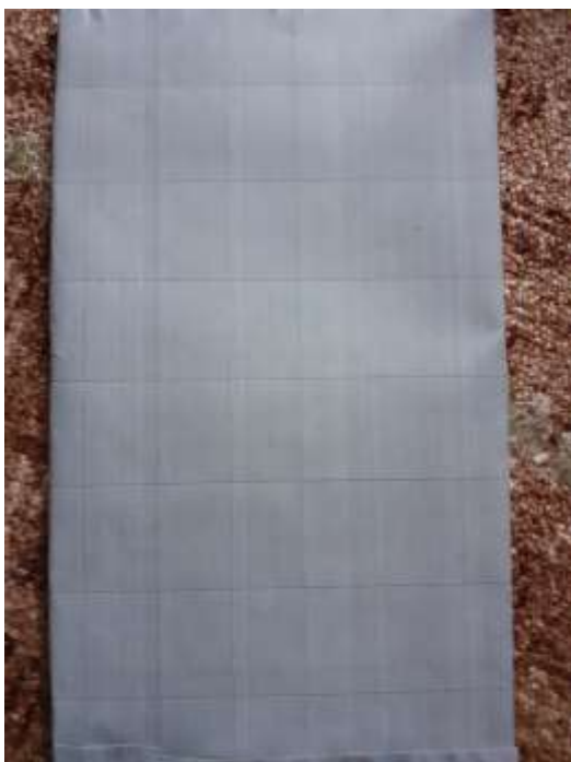
obr. 38 Kachličky do koupelny