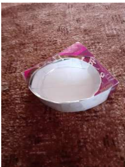
obr. 34 Výroba vany