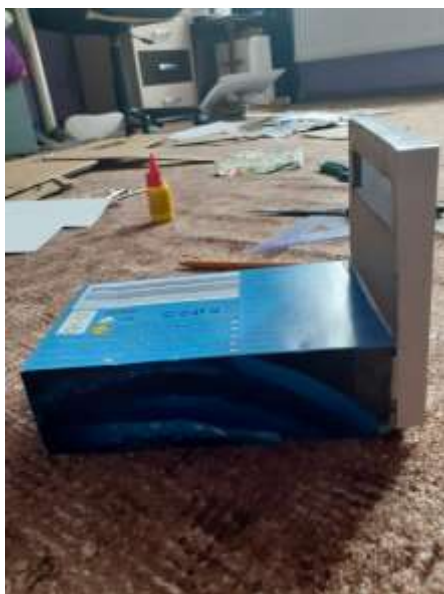
obr. 24 Postel