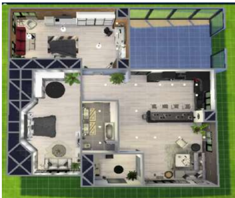
obr. 1 Navrhnutý dům

Jako úplně první jsem si musela udělat návrh. Tak jsem si zapnula hru The Sims a tam si tenhle dům postavila.