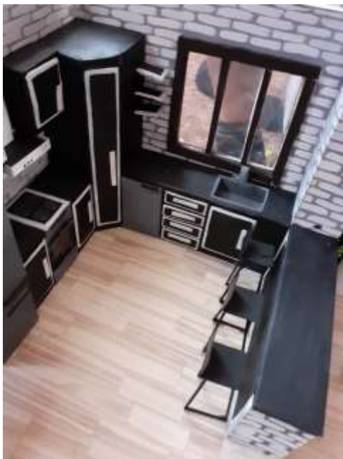
obr .52 Kuchyň