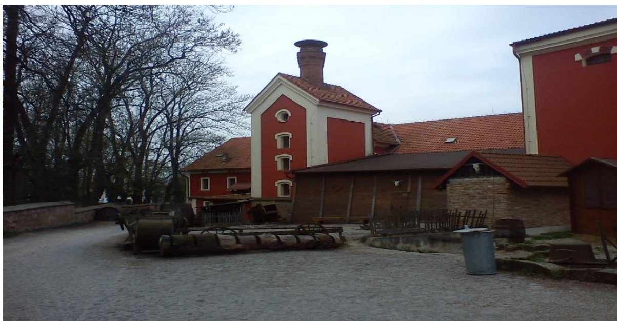
Obrázek 10 Pohled na pivovar a krčmu

Tato restaurace byla založena roku 2001. Časy se mění a i tato krčma už si prožila své, ale přesto je to místo, kde člověk když chce a opravdu si bude užívat všechno, co mu nabízí, bez problémů se přenesení zpět do dob středověkých, kdy se opravdu tančilo na stolech, chrlič plivali oheň a od ďábla čistili ženy jakéhokoliv věku. Samozřejmě se vše musí brát s rezervou. Za celý rok pobývání v této krčmě jsem měla možnost zaslechnout pár povídaček. Například, že se po předním sále až na kamenný sál prošla bílá postava, nebo že si kdosi rád pohrával s okny horní krčmy, která byla mimochodem už velice dobře zamčená. Někteří i povídali, že „kostnice“ jak tomuto sálu zde říkáme, není zvláštní jen díky lebkám na stěnách. Říká se, že má ve zdi ukrytá těla mrtvých osob. Jestli je to pravda, nebo ne netuším, ale je to zvláštní a vždy když se na tuto krčmu podívám v noci za svitu obyčejných žárovek, vypadá opravdu neobyčejně. Je to taková mohutná stavba s tajemstvím.