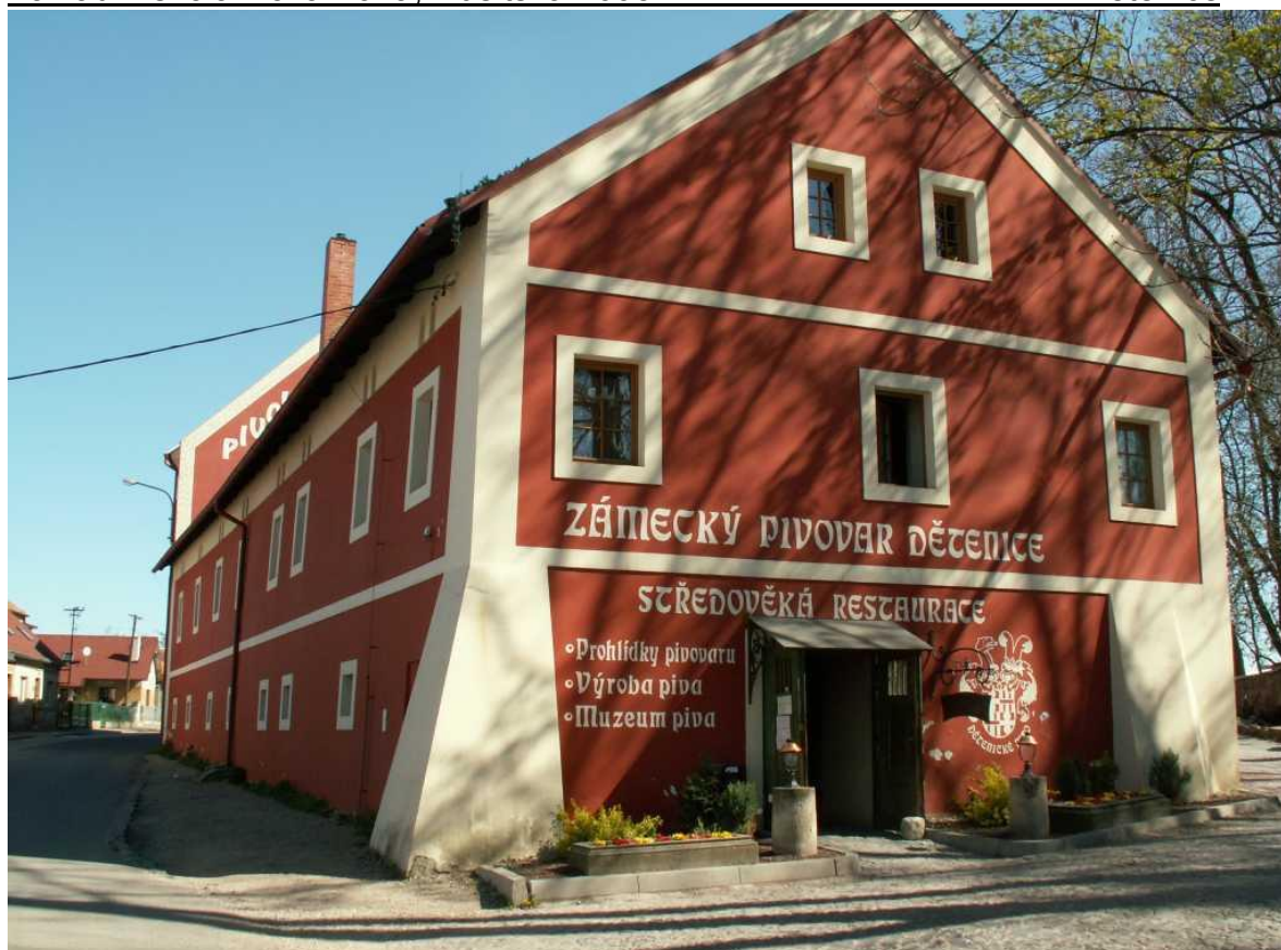
Obrázek 11 Krčma