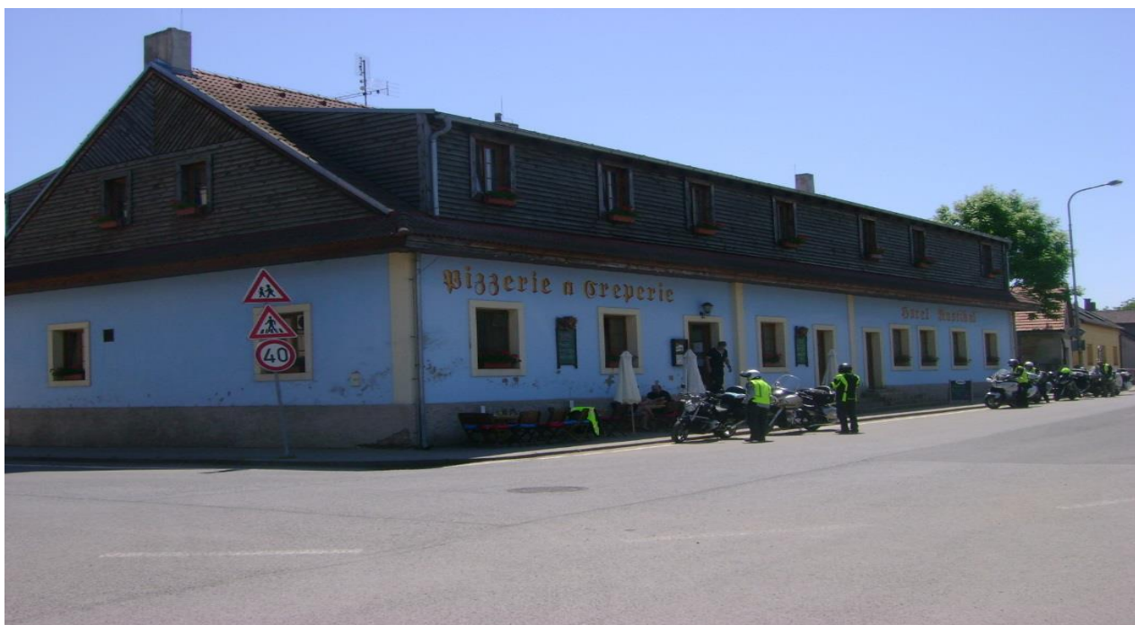
Obrázek 17 Hotel a pizzerie Rustikal