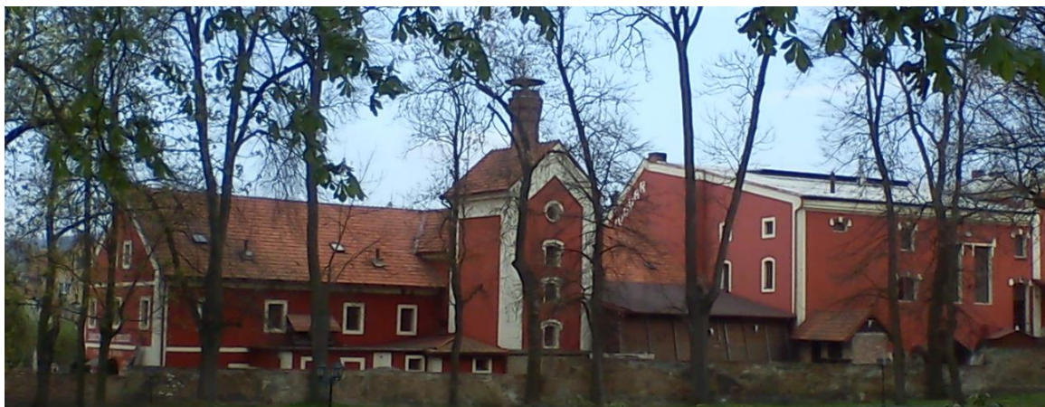
Obrázek 1 Krčma a pivovar