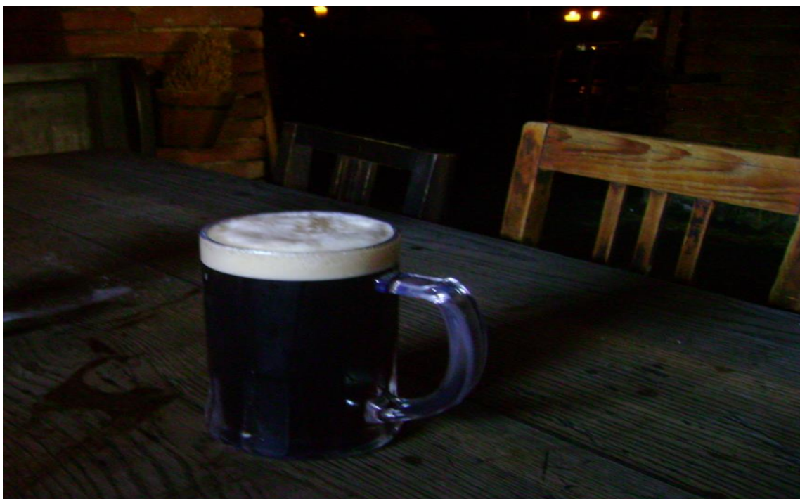
Obrázek 9 Tmavé pivo lásky