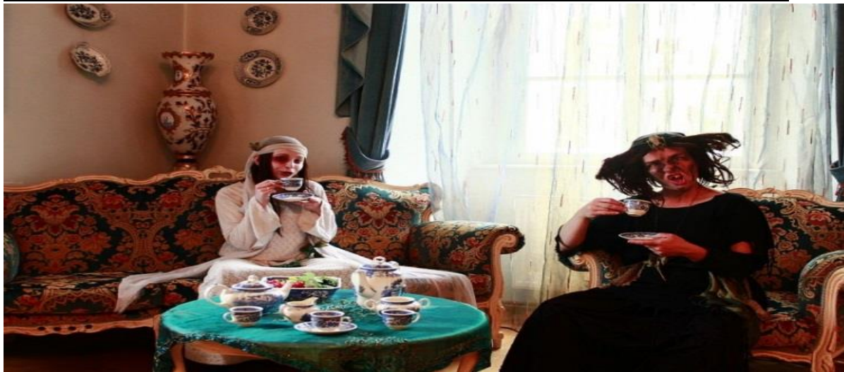
Obrázek 7 Strašidelná prohlídka