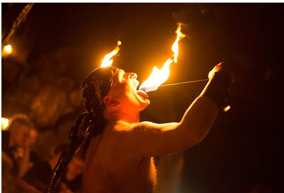
Obrázek 13 Ohnivá show