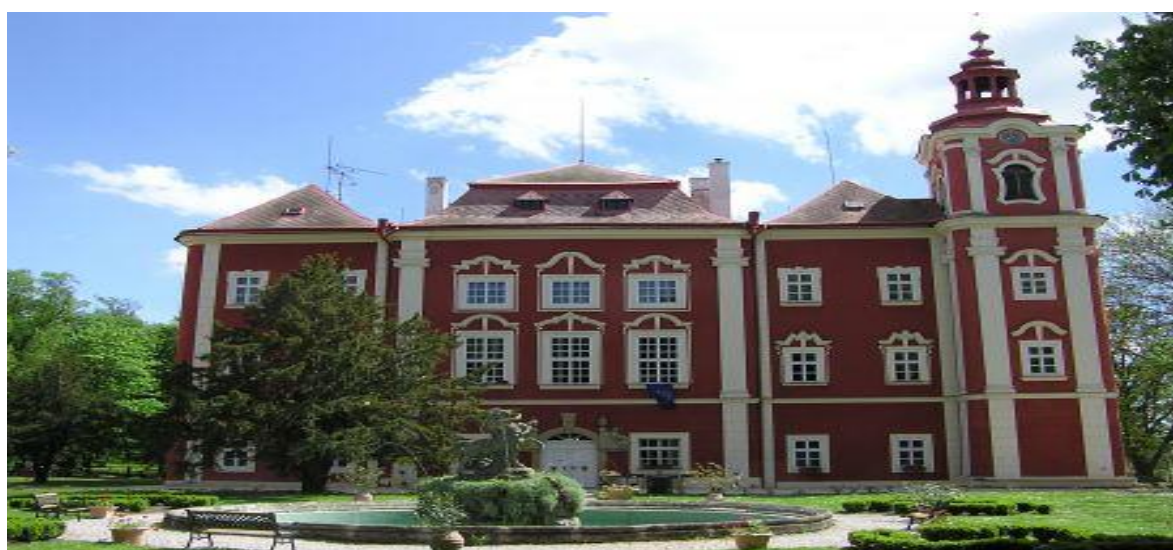
Obrázek 4 Zámek Dětenice