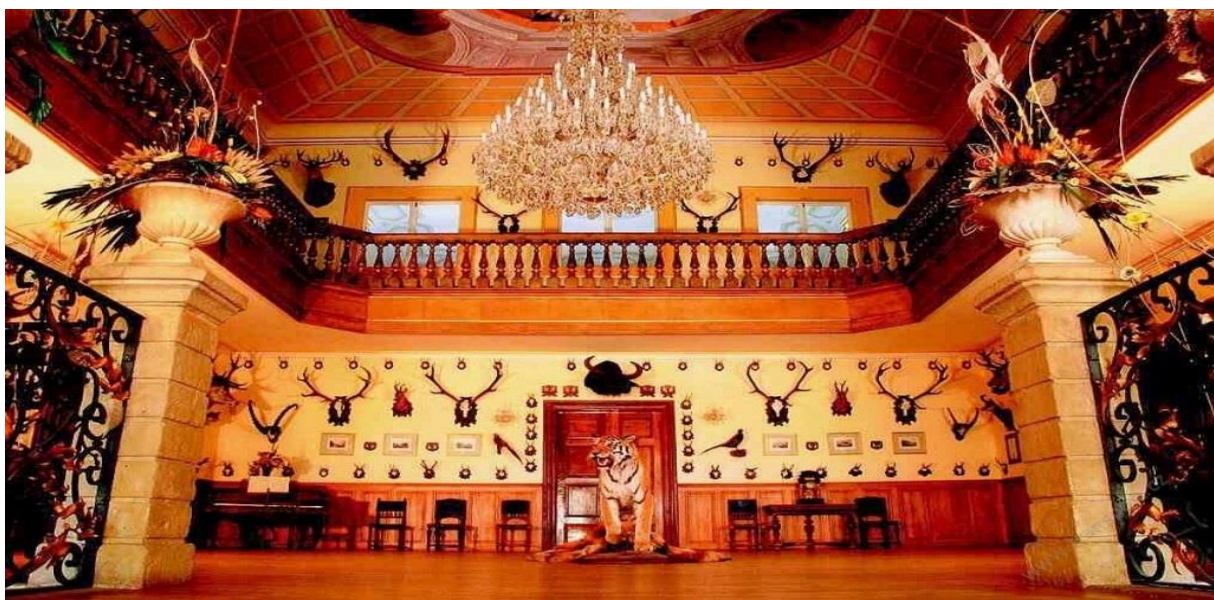
Obrázek 6 Taneční sál