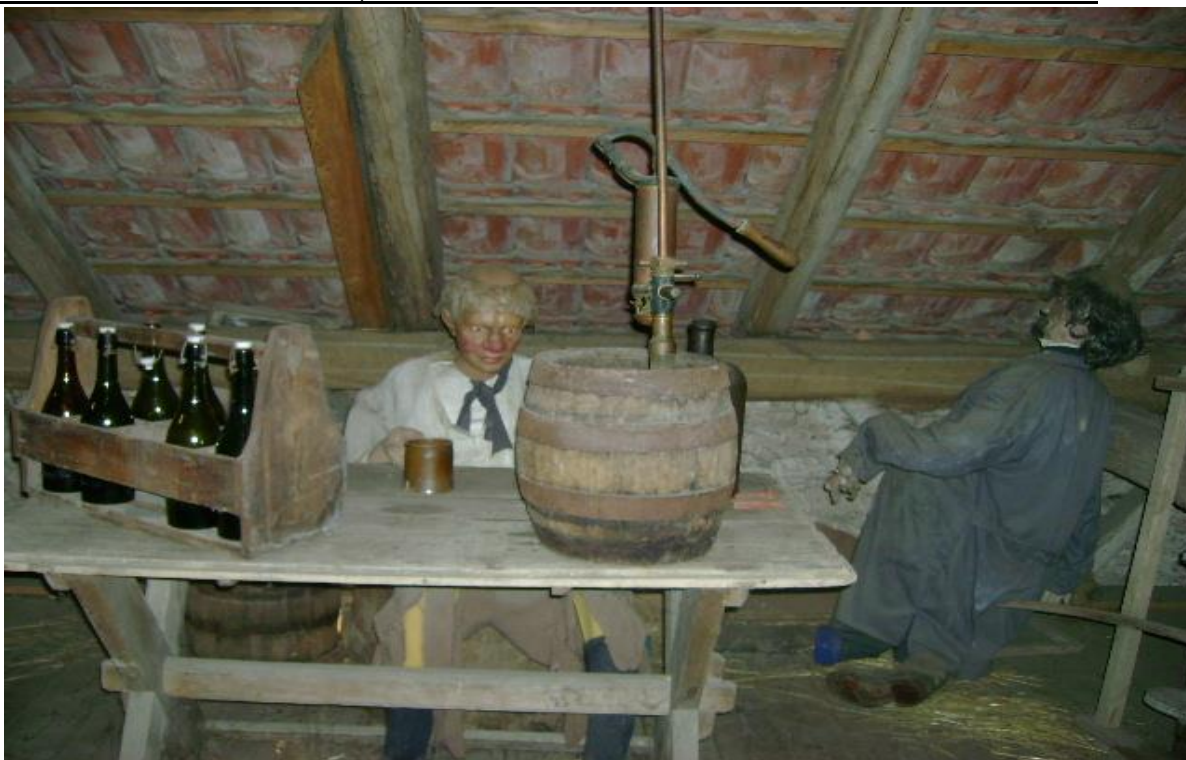
Obrázek 12 Jedna z figurín v pivovaru