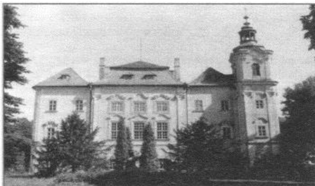
Zámek Dětenice

Úvodem bych se pokusila napsat záměr své práce. Vybrala jsem si tuto absolventskou práci proto, že už od svého dětství mám vztah k tomuto místu, prostředí i k práci v Dětenicích. Tento vztah trvá i nadále. Trávím zde volný čas nejen zábavou, ale i prací. Naskytla se mi možnost mít brigádu, která je pro mě možná pouze o víkendech a prázdninách. Mohu roznášet nápoje, pokrmy, ale také připravovat různé občerstvení. Tato práce, jako každá jiná, má svá pozitiva i negativa. Velkým kladem je životní zkušenost, ale třeba i nová přátelství. Velkým záporom je stres. Zaměřila jsem se na historii pivovaru a zámku a zároveň na nejasné historické pověsti týkající se okolí Dětenic.