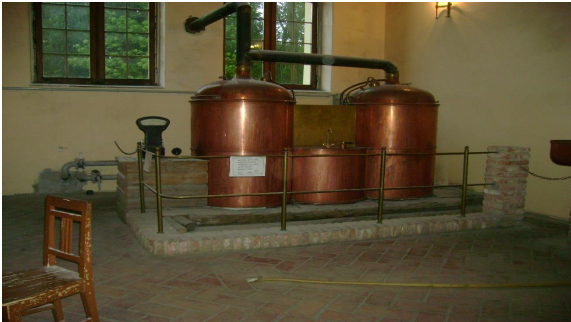
Obrázek 8 Varna pivovaru

hektolitřů. Roku 1948 začalo znárodňování a pozdější rušení mnoha pivovarů. Dětenický pivovar byl zavřen roku 1955. V roce 2000 ho koupil pan Ondráček a obnovil výrobu piva.